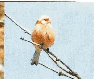
↑真っ赤なからだの ベニマシコ (夏)