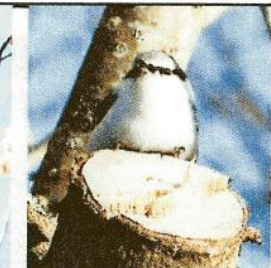
↑ぶっくりまあるい ゴジュウカラ (冬)