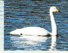
↑ゆうがに たたずむ オオハクチョウ (秋・冬)