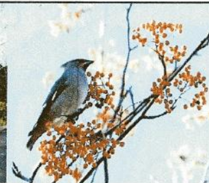
↑りりしいすがたの キレンジャク (冬)