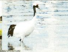
↑なが〜い くちばし タンチョウ (春・夏)