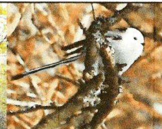
↑白くてカワイイ シマエナガ (冬)