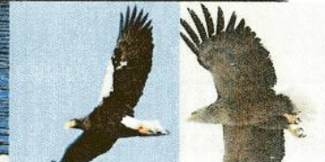
↑冬の王様オオワシ (左)とオジロワシ (右) (冬)